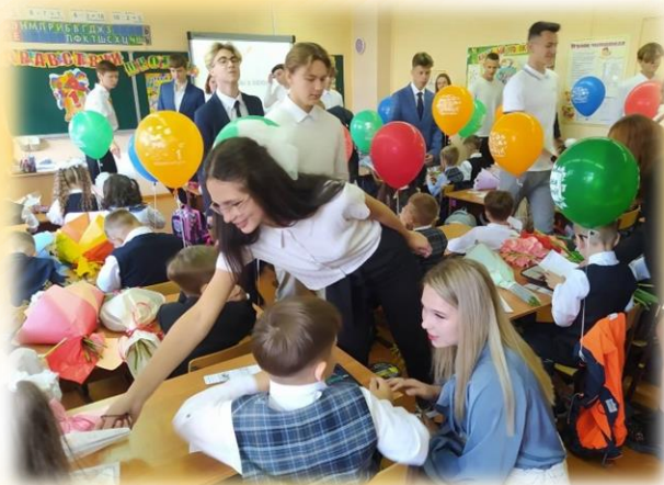
Акция «Самолётик будущего»

Выпускники школы сделали самолётики из бумаги и написали на их крыльях напутственные слова. На первом уроке учебного года первоклассники раскрыли самолетики и прочитали пожелания сами или с помощью классных руководителей. Проведение первого урока основ безопасности жизнедеятельности, "Разговоры о важном". А впереди нас ждёт ещё много всего интересного. Ведь учебный год только начинается!