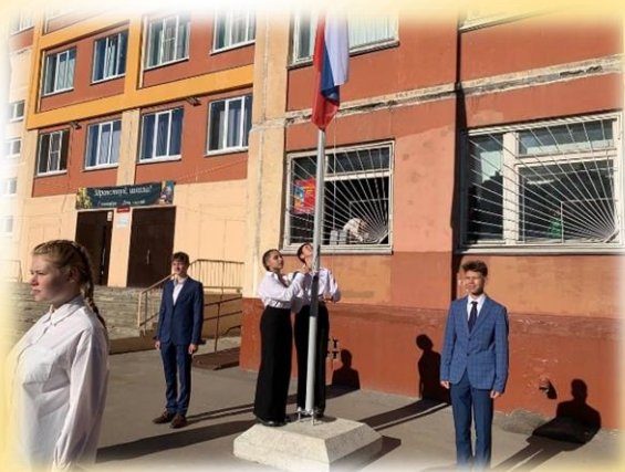
Подъем Государственного флага Российской Федерации

В этот день в нашей школе прошло очень много мероприятий. И сейчас мы хотим рассказать и показать самые интересные моменты.