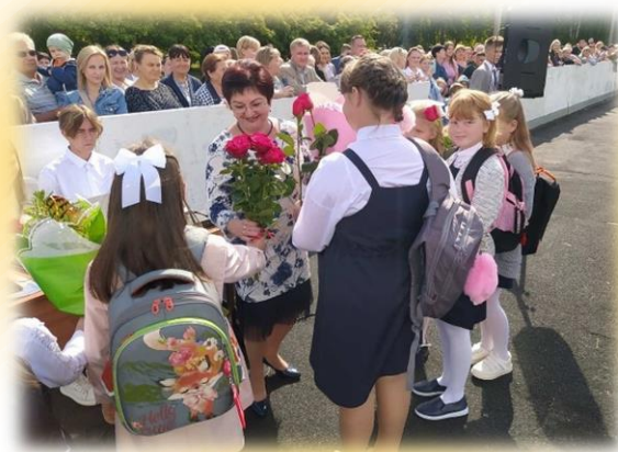
2 торжественных линейки, посвящённых началу учебного года