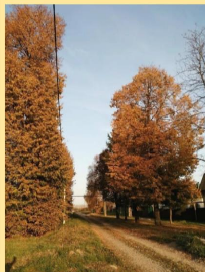
Шмелькова Дарья 8Б