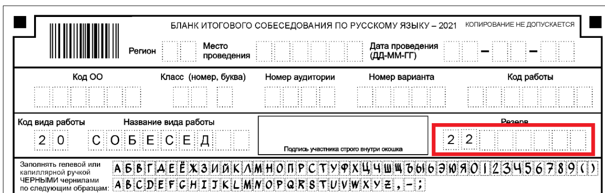
Рисунок 2. Заполнение поля «Резерв» для участников с ОВЗ