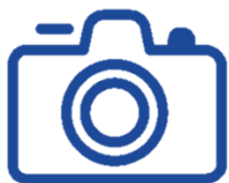
Фото-зоны на тему сказок